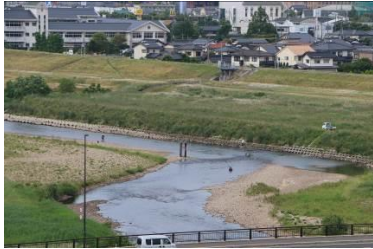
1級河川天神川を望む絶景を楽しめます。この季節はアユ釣りをする釣り人の姿も

【発行】 伯耆しあわせの郷 ☎ 26 - 5581 http://www.shiawasenosato.jp 指定管理者 旭ビル管理株式会社