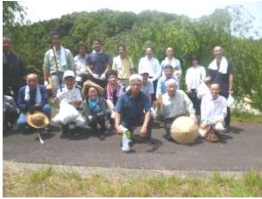
作業が終わって全員で記念撮影