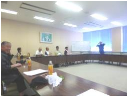
樹木医さんによる勉強会

作業終了後、樹木医さんによる樹木の育成講座が開かれ、肥料についての知識や樹勢の回復の方法などの勉強会を行いました。さらに食事をしながら交流を行い有意義な育成作業となりました。秋にも同様な作業を予定しています。