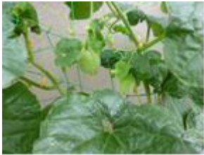
今年の夏ミニメロンのグリーンカーテンを育てています。

「開館当時の思い―夢の提案者」 昨年度の当施設の利用者は貸館・個人利用者を合わせて 31,291 人、教室の述べ受講者は 19,432 人、イベントその他を合わせると 57,577 人の方がご利用いただきました。これは一昨年と比べると 4.4% の増加となりました。さらに小児検診などの保健センター業務合わせると 72,099 人の方に利用いただきました。ありがとうございました。さとうございました。さて、当施設は平成5年4月に開館しました。当時の市報を拝見してみると「これから迎える社会に夢を提案します」それぞれの方が求めるもの―それに応えることのできる夢の提案者が「伯耆しあわせの郷」なのです。さあ、あなたの楽しみを見つけてください。と書かれていました。当時の伯耆しあわせの郷に対する意気込みを感じる文章です。非常に高い理想でのこの思いを色あせさせてはならないと・・・。