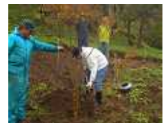
市長さんも参加 されました