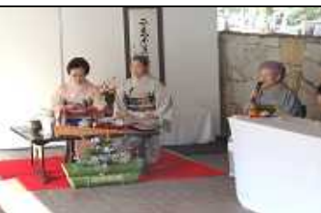
お点前のスタート