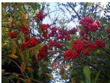
ナナカマドが鮮やかな実をつけました。

この頃めつきり寒くなって参りました。皆様体調はいかがですか。街の中も秋の行事からクリスマスや正月を迎える準備とはつきりと切り替わっています。伯耆しあわせの郷でも先日来年の干支を作る教室が行われました。今月は「キムチづくり教室」や「クリスマスケーキ作り教室」と季節を反映した特別教室が行われます。今年も残すところ、あと一ヶ月となつて参りました。今年やり残したことはございませんか。受験生はこれから追い込みの時期ですね。当所でも来年度の教室の募集についての準備がすでに始まりました。今年いろいろお世話になりました。そして来年もどうぞよろしく願います。