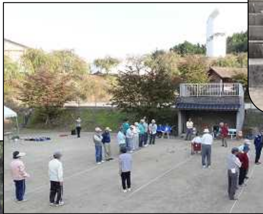
決勝戦は僅差の白熱した試合でした 秋晴れの下、競技スタート