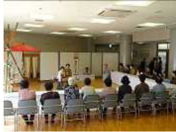
小笠原流煎茶お茶席