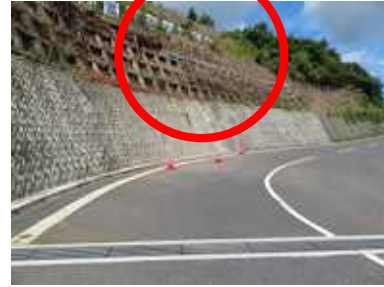
しあわせの郷入口

先日の台風十二号の影響で、しあわせの郷入口側面が崩落しています。ご通行の際は十分にご注意ください。