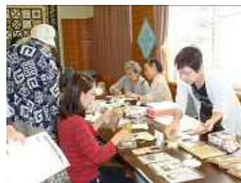
パッチワーク展示・体験