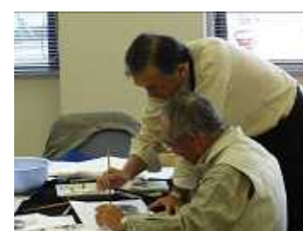
日本画展示・体験