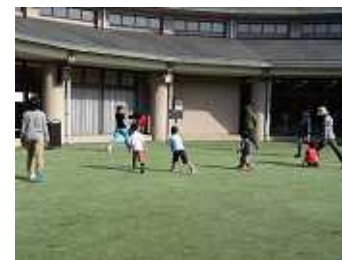
エアロビクス体験