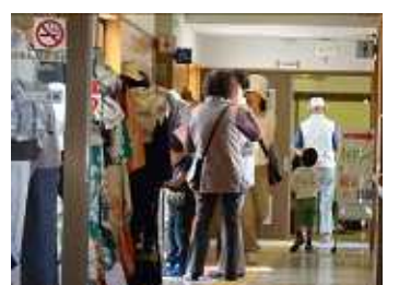
きもの着付け展示・体験