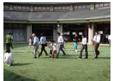
ノルディックウォーク体験