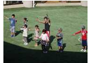
縄跳び超人みっちゃん