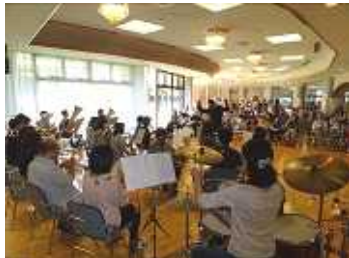
米子ウインドオーケストラ