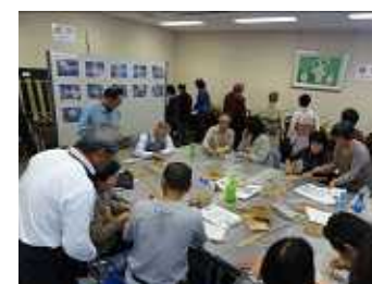
竹細工展示・販売・体験