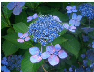
今年は短かったアジサイの似合う季節

例年に比べ、一週間間余りも早く梅雨があけて、今年の夏も相変わらずの暑さのようです。「暑い！暑い！」という大人たちを後目に、子供たちとしては、楽しみな夏休みがやってきました。昔の子供たちは夏休みと言えば、川で魚とり、水泳、虫取り等と友達と外で遊んだものですが、最近では友達と家でゲームなどと、たぐまさがなくなってきたようです。伯耆しあわせの郷では、今年も「夏休み！こどもワイワイスクール」を開講します。例年の講座に加え「ものづくり」に興味を持ってもらうための講座を三種類用意しました。自然の仕組みに興味を持ち、人間にとって有益なもの、楽しいものを作り出す『ものづくり』の楽しさをぜひ味わってください。