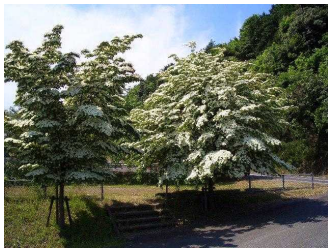
雪が降ったように白い花をつけた『山法師』の花

【発行】 伯耆しあわせの郷 26 5581 http://www.shiawasenosato.jp 指定管理者 旭ビル管理株式会社