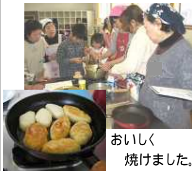
おいしく 焼けました。

今回の教室では2種類の『ピロシキ』を作りました。少人数ならではの和やかな雰囲気の良い教室となりました。