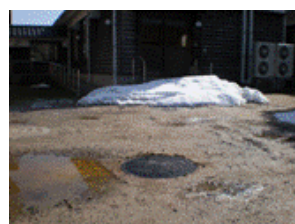
〔 修理前 〕