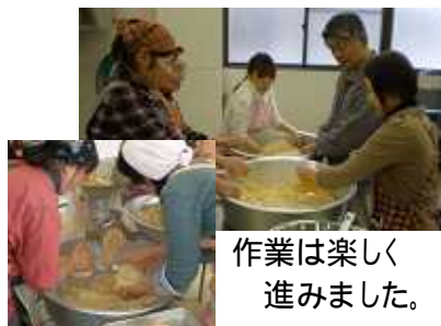
作業は楽しく 進みました。

「自分で作った味噌を食べる。」今年の秋の楽しみが一つ増えたのではないのでしょうか。