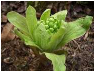
「ふきのとう」が春の訪れを告げます