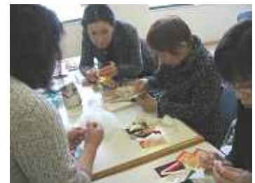
細かい作業に夢中になります。

「自分で作った味噌を食べる。」今年の秋の楽しみが一つ増えたのではないのでしょうか。