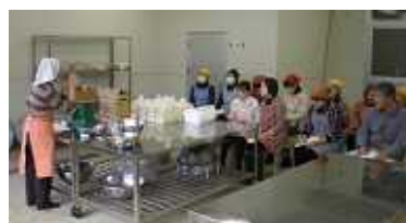
講師の話をお熱心に聞く受講生