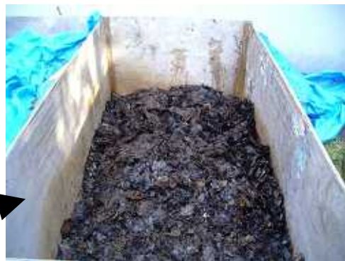
出来上がった腐葉土