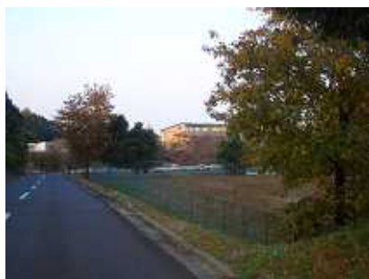
広大な敷地の伯耆しあわせの郷

伯耆しあわせの郷が実は広大な敷地を要しているということ意外とご存じない方が多いのではないのでしょうか。ほとんどの方が正面玄関から上がってこ来館されます。そのまままっすぐクリンセンターのほうに行かれると、ゲートボールはもちろん、ペタンク、グラウンドゴルフ練習等が行えるグラウンドがあります。また道を挟んで駐車場の向いは多目的に利用できる広場になっています。室内の利用だけでなく屋外施設を使った健康づくりの施設として大いに活用ください。