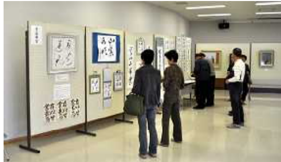
受講生と講師の作品を展示