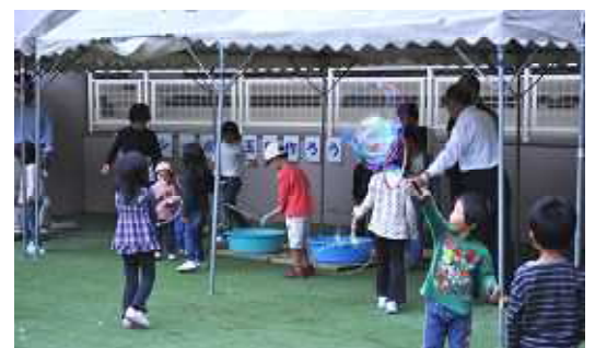
バルーンアートに挑戦