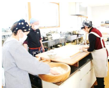
水回し・練り・のしの工程に汗をかく参加者のみなさん

12月6日、あぜくら蕎麦同好会のみなさんにご協力いただき、年末恒例のそば打ち教室を開催しました。18名の受講者のみなさんは3名ずつのグループになって、上手にそばを打ち上げました。挽きたて・打ちたて・茹でたてのそばをおいしくいただきました。