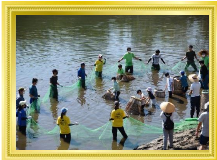
農業農村フォトコンテスト 準特選 豊漁を期して

第 29 回農業・農村フォトコンテスト（鳥取県土地改良事業団体連合会主催）に応募された 豊漁を期待して が準特選に選ばれました。