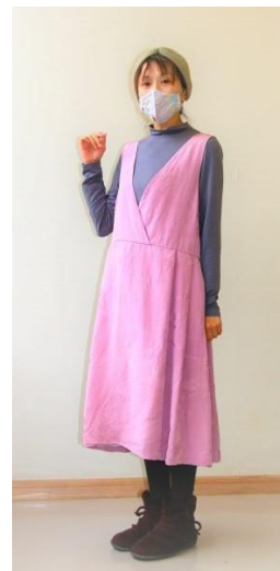
👉着物をリメイクしたワンピース

特別な道具がなくても手縫いでできるソーイングのスキルを楽しみながら身につけられます。着なくなった洋服や着物などをリメイクして、新たな命を吹き込んでみましょう。 ■教室日時 第2・4金曜日 午後1~4時