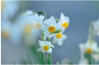
春を待ちわびる 雪の中に咲く水仙。

【発行】 伯耆しあわせの郷 ☎ 26 - 5581 http://www.shiawasenosato.jp 指定管理者 旭ビル管理株式会社