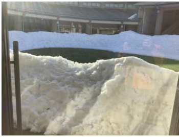
当施設のイベントホールの雪です。何年振りかの風景です。