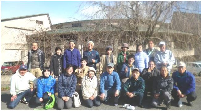
作業後皆で記念撮影

12月8日、約200本植栽してあるしだれ桜の施肥作業を行いました。施肥の効果は根に栄養を与え、新しい芽の育成を促し樹勢を高めることが出来ます。参加者は大学生・高校生含む25名でした。この度は合わせて20本のモミジを植栽しました。桜とモミジは陽と陰と一緒に植えるにはとても相性の良い木だそうです。作業後は勉強会もしました。