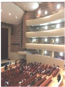
マリンスキー劇場

また、マリンスキー劇場で観たバレエは、素晴らしく、生オーケストラ付きの本格的なもので3千円と格安でした。芸術が身近なロシアの一端です。そして、シベリアで抑留されて死亡した日本人慰霊碑にお参りしました。抑留者60万人のうち6万人の方が亡くなられました。未知の国ロシア、一度行ってみられませんか。(完)