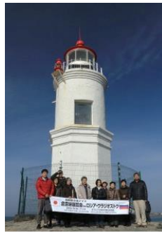
トカレフスキー灯台

市内の建物はいずれもカラフルな装飾や色を施したヨーロッパ風です。気になる経済事情ですが、5年前に行った時、1ルーブル3円ほどでしたが、現在では1円程に下落しています。でも日本から観光に行くには良いと思います。また給与は、大卒初任給で2万ルーブル程、日本円で3万5千円ですから生活はそう楽ではないようです。それでも若い女性たちは綺麗に着飾り給与の半分が洋服代だなどと言う話も聞きました。