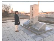
シベリア抑留慰霊碑