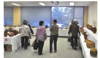
竹細工教室・展示・販売