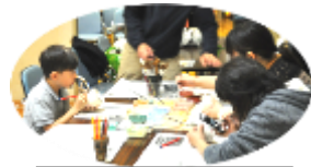
陶芸教室絵付け体験