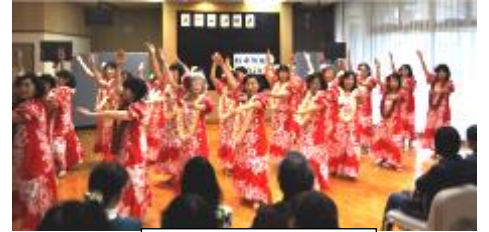
ハワイアンフラ教室