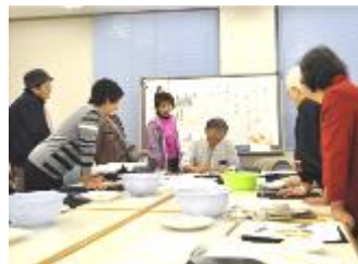
日本画教室・展示・体験