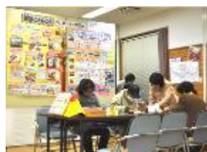
マレボジャ!韓国語教室