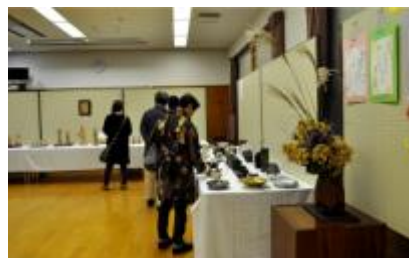
仏像彫刻教室・陶芸教室・文芸教室