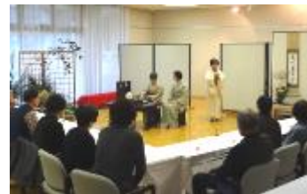
小笠原流煎茶お茶席