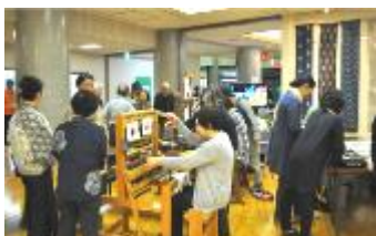
織物教室・展示・体験&販売