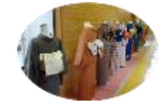
きもの着付教室・展示・体験