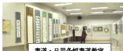
書道・日用条幅書道教室