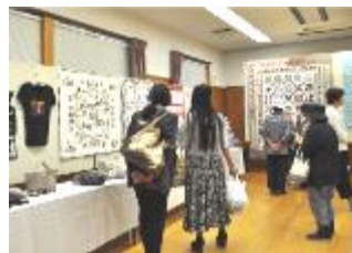
パッチワーク教室・展示・販売