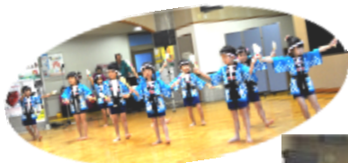
上北条保育園の園児たち