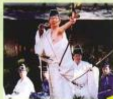
鎌倉時代より続く 武家文化を継承する小笠原流

※但し、事前のお申し込みが必要です。 伯耆しあわせの郷までお電話でお申し込みください。 TEL.0858-26-5581