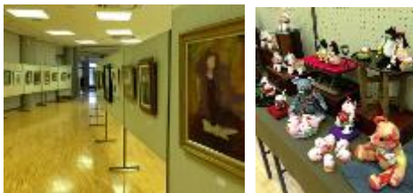
※写真は以前の様子です