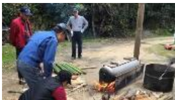
苛性ソーダを使い油抜き作業