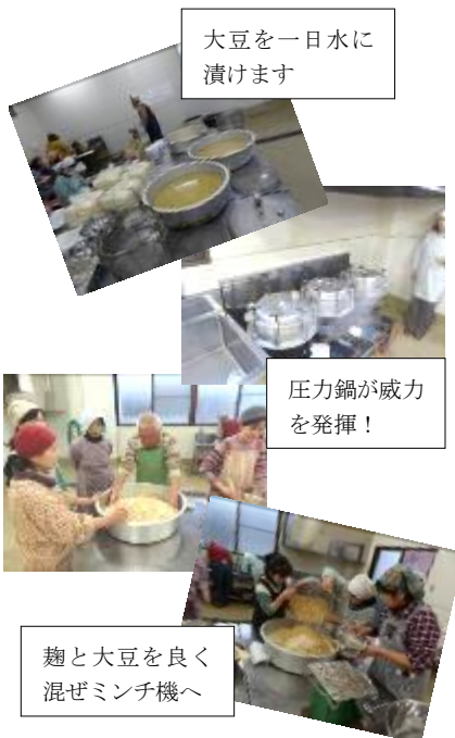
大豆を一日水に漬けます