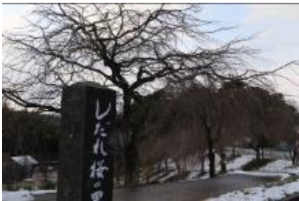
冬の寒さの中で、力を蓄え、じっと芽吹きの時を待つ伯耆しあわせの郷のしだれ桜

【発行】 伯耆しあわせの郷 ☎ 26 - 5581 http://www.shiawasenosato.jp 指定管理者 旭ビル管理株式会社